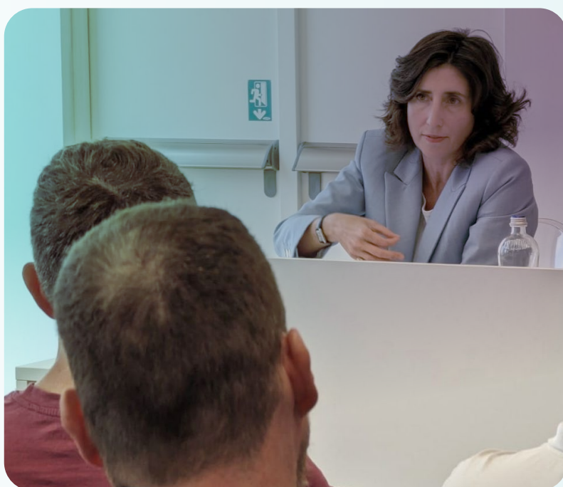
Foto realizzata durante la prima edizione del corso Executive in Digital Transformation